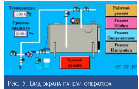
Рис. 5. Вид экрана панели оператора

Автономная система автоматизированного управления позволяет проводить технологические операции (заполнение, охлаждение, хране-