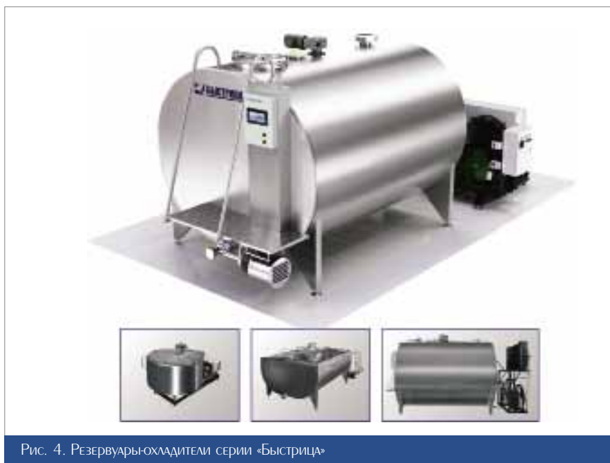
Рис. 4. Резервуары-охладители серии «Быстрица»

Снижение энергозатрат достигается использованием пластинчатого теплообменника для предварительного