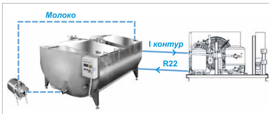
Рис. 1. СИСТЕМА С НЕПОСРЕДСТВЕННЫМ ОХЛАЖДЕНИЕМ

Почти все способы основаны на том, что молоко отдает тепло охлаждающей жидкости через разделяющую их стенку.