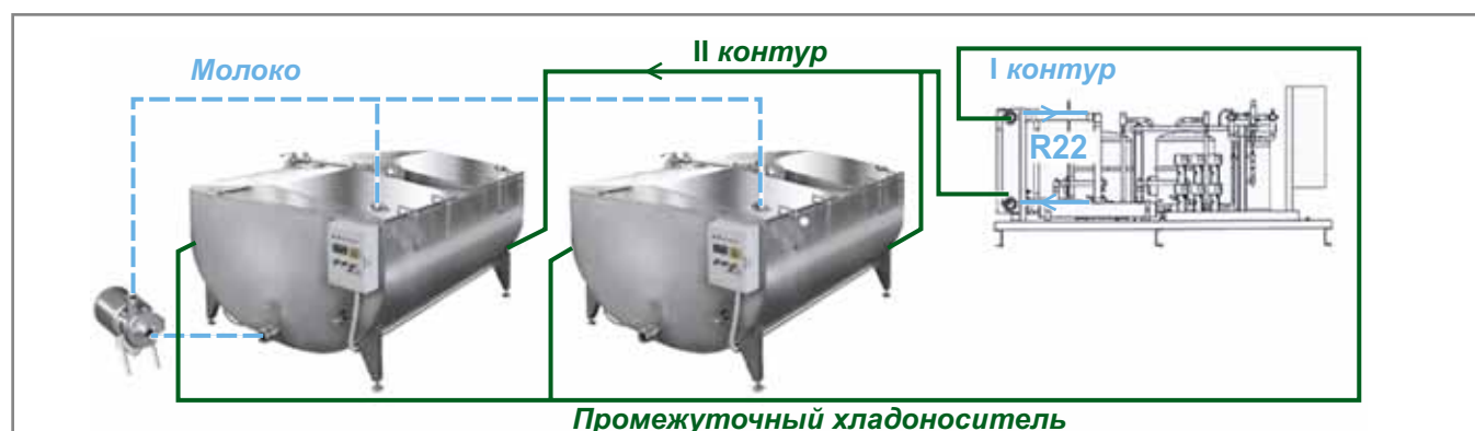
Рис. 2. СИСТЕМА С КОСВЕННЫМ ОХЛАЖДЕНИЕМ

Самая простая система объемного охлаждения требует открытого резервуара с холодной водой. Молочные бидоны помещаются в резервуар и погружаются в воду. Вода должна быть проточной или периодически